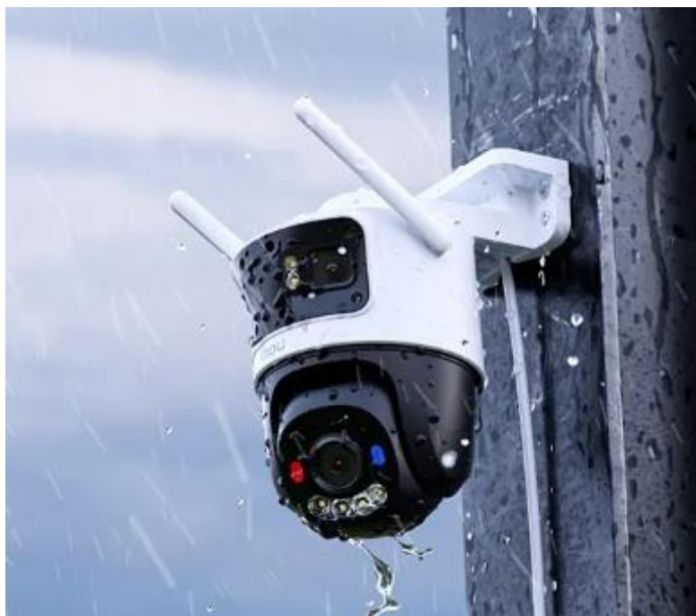
Cámara IMOU Triple Lente Características